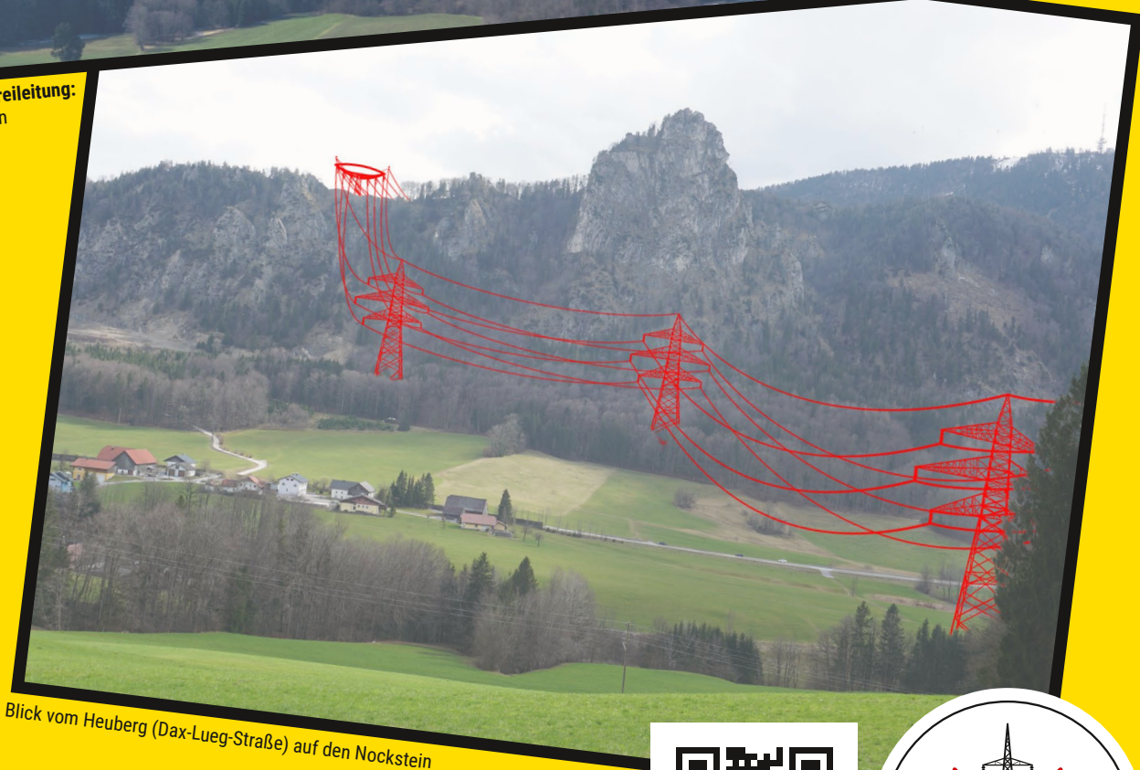
Blick vom Heuberg (Dax-Lueg-Straße) auf den Nockstein