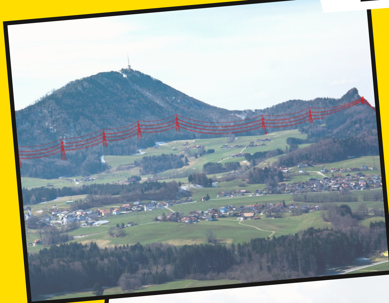
Verlauf 380-kV-Freileitung: Blick über Koppl in Richtung Westen